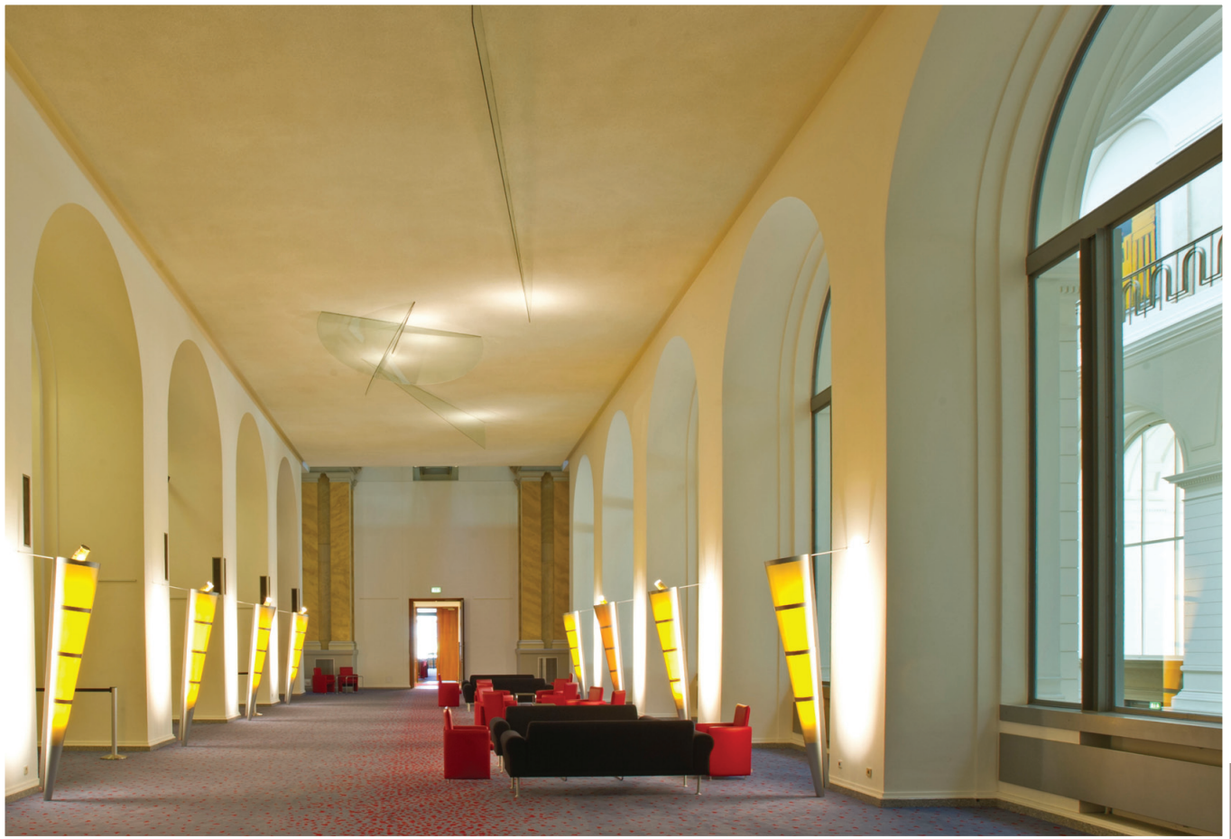
Wandelhalle heute

Der Trend zur Vereinfachung setzte sich in den 50er Jahren verstärkt fort. Die Kassettendecke wurde grundlegend umgestaltet: Helle Balken, dicht an dicht quergelagert, hoben sich scharf von der braunen Decke ab. Die Türen zum Plenarsaal wurden zugemauert, die Wände und Pfeiler glatt verputzt und der Boden mit grauen Kunststoffplatten verlegt. Als Sitzungssaal ungeeignet, wurde die Wandelhalle in den folgenden Jahren als Sonderverkaufsstelle für Jeansbekleidung und für die damals ansässige HO-Betriebsverkaufsstelle sowie als Frauengymnastikraum genutzt.