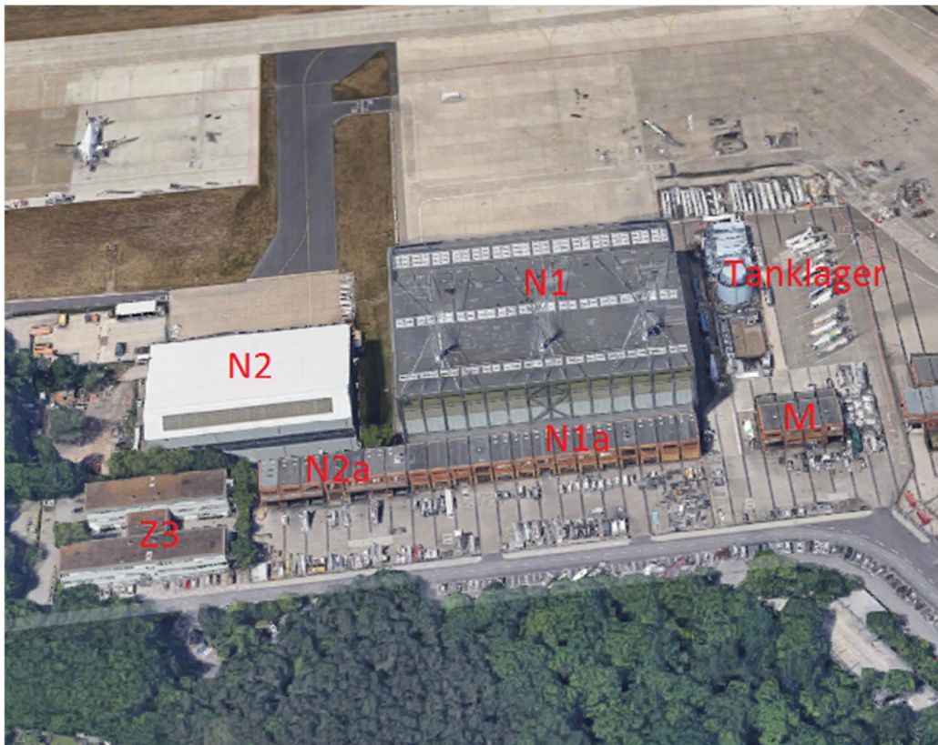
Abb. 1: Luftbild Bestandsgebäude