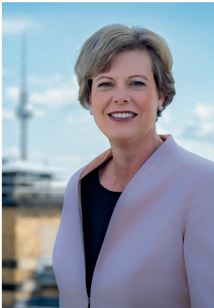
Cornelia Seibeld Präsidentin des Abgeordnetenhauses von Berlin